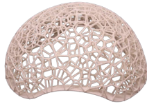
头盔 尼龙 280mm*260mm*180mm