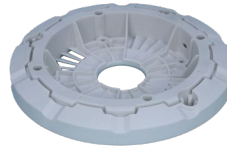
电机底座壳体 尼龙 340mm*340mm*50mm