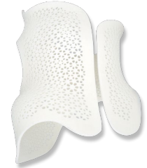
脊柱矫形器 尼龙 320mm*280mm*350mm