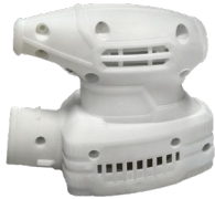
电动工具外壳 尼龙 135mm*40mm*100mm